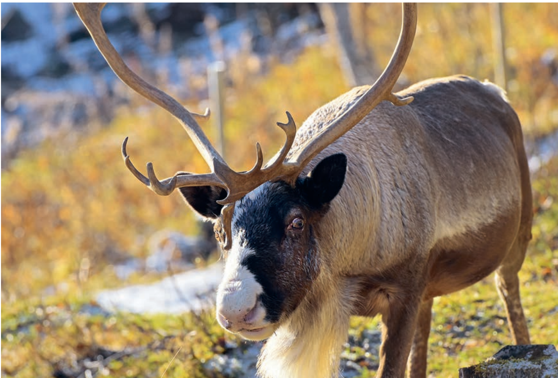
Rentierzucht in der norwegischen Region Storheia: Wenn sie verschwindet, stirbt auch die Kultur der Südsami.