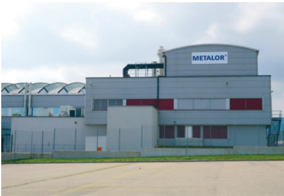
Die Raffinerie Metalor Technologies SA in Marin-Epagnier bei Neuchâtel.

Doch wie und über welche Kanäle gelangt das illegale Gold überhaupt in die Schweiz? Unsere Nachforschungen haben aufgedeckt, dass die Goldexporte der Firma Minerales del Sur seit Frühling 2014 massiv zugenommen haben. Dies geschah zur selben Zeit wie die Goldbeschlagnahmungen bei dubiosen Firmen und der Einstellung ihrer Aktivitäten. Minerales del Sur darf zwar von GoldwäscherInnen in Puno, die im Formalisierungsprozess sind, Gold aufkaufen. In dieser Region sind allerdings nur 3'451 Personen von geschätzten 100'000 GoldwäscherInnen im Formalisierungsprozess und nur 800 Personen haben eine Abbaubewilligung. Trotzdem hat Minerales del Sur seit 2008 bereits rund 50 Tonnen Gold an Metalor geliefert. Der Vergleich verschiedener Statistiken zeigt, dass die Firma bedeutend mehr Gold exportiert als in der Region Puno offiziell produziert wird. Titán Contratas Generales und Famy Group sind weitere Goldhandelsfirmen, die Metalor auch heute noch mit grossen Mengen Gold beliefern. Gegen alle drei Unternehmen ermittelt die peruanische Staatsanwaltschaft unter anderem wegen Geldwäscherei. Da der Fall der Famy Group in die peruanischen Medien gelangte, hat Metalor bei der schweizerischen Meldestelle gegen Geldwäscherei im April 2014 eine Verdachtsmeldung eingereicht. Ausserdem hat die Staatsanwältin gegen Geldwäscherei in Peru einen Antrag auf Rechtshilfe an die Schweizer Behörden gestellt.