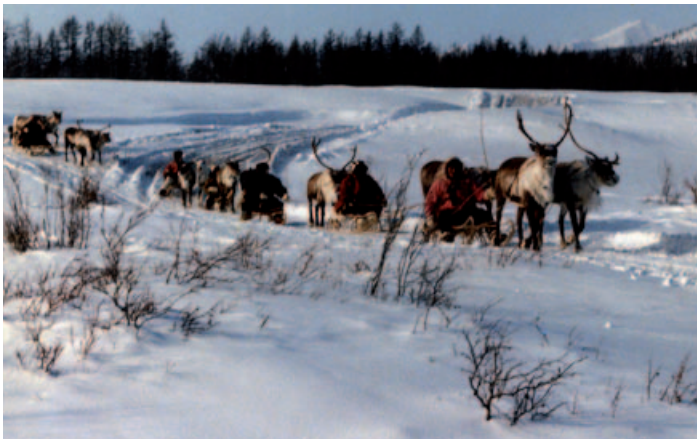
Peu de Tchouktches vivent encore de l'élevage des rennes.