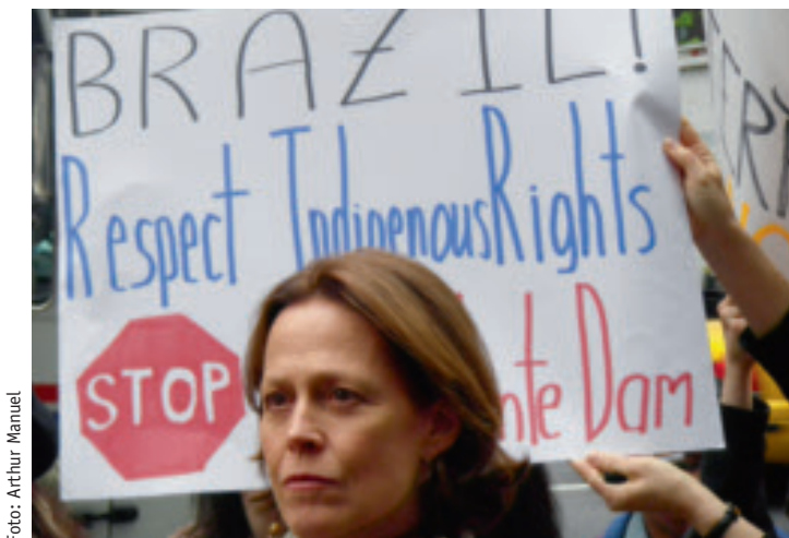
Eine Demonstration in New York gegen den Belo Monte-Staudamm erhält prominente Unterstützung von Avatar-Schauspielerin Sissy Weaver.