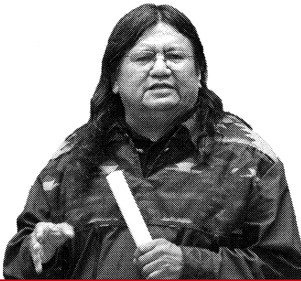
Arthur Manuel: Ein Kämpfer für die Rechte der Indigenen Kanadas

meinschaft gehört, der Sie auch angehören (siehe S. 6-7). Wir kämpfen zwar noch immer gegen Sun Peaks, aber wir können das Projekt nicht mehr stoppen.