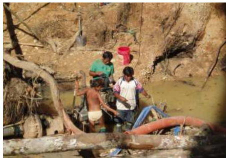
Illegale Kleinschürfer in der Region Madre de Dios