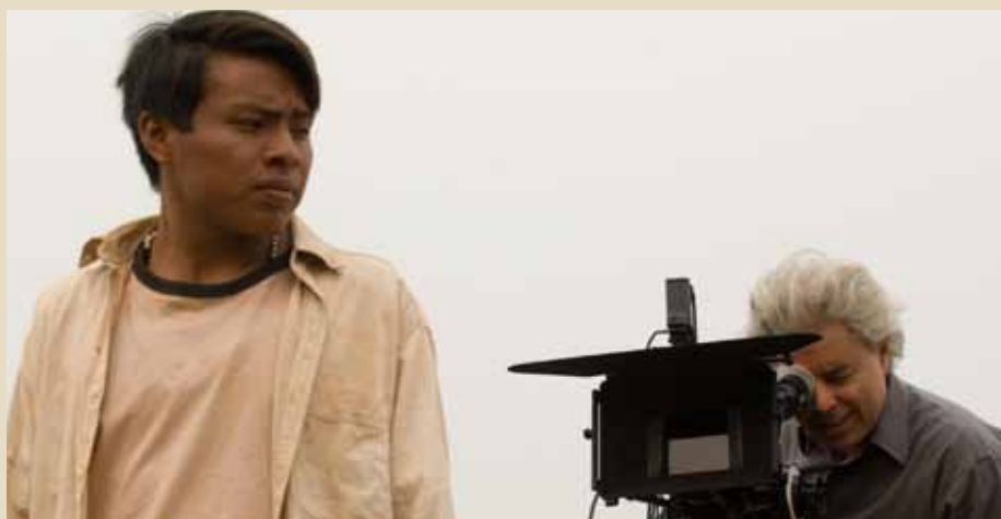
Le réalisateur, Marco Bechis (à droite), lors du tournage de «Birdwatchers» avec l'acteur autochtone Abrisio Da Silva Pedro.

La caméra survole une forêt dense, d'un vert profond, puis un champ, la terre fertile aux reflets cuivrés; les sillons sont bien visibles dans la terre. Un arbre se dresse isolé, libre. C'est sur cette image que se termine le film de Marco Bechis, «Birdwatchers». La forêt et le champ: voici deux sphères que Bechis met en opposition dans son film. Elles renvoient au monde des autochtones et à celui des grands propriétaires terriens. Au monde de ceux