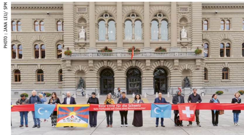
Des militant·e·s et des politicien·ne·s tracent une ligne rouge sur la Place fédérale lors de la remise de la pétition le 18 septembre.

Le 27 août, la Commission de politique extérieure du Conseil national (CPE-N) a déclaré qu'elle soutenait le mandat de négociation du Conseil fédéral pour le développement de l'accord de libre-échange avec la Chine. Ce faisant, elle s'est exprimée contre une étude d'impact sur les droits humains de l'accord et contre des dispositions relatives aux droits humains contraignantes. La commission s'est contentée d'obliger le Conseil fédéral à intégrer dans les négociations une évaluation de la stratégie Chine en cours ainsi que le rapport en attente sur la situation des Tibétain·ne·s et Ouïghour·e·s en Suisse.