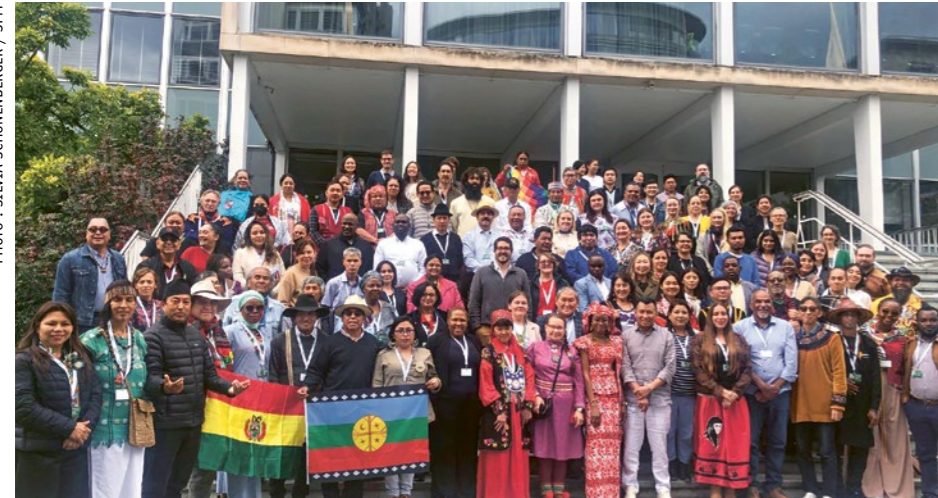
Uni·e·s pour une transition énergétique juste : représentant·e·s des communautés autochtones de toutes les régions autochtones du monde.

Du 8 au 10 octobre 2024, plus de 100 délégué·e·s du monde entier se sont rencontrés à Genève. Ils·elles se sont demandé comment arriver, du point de vue des autochtones, à une économie durable en passant par une transition énergétique juste. Selon les délégué·e·s, les solutions aux crises écologiques doivent prendre en compte le savoir autochtone plutôt que de reprendre les schémas coloniaux de l'exploitation.