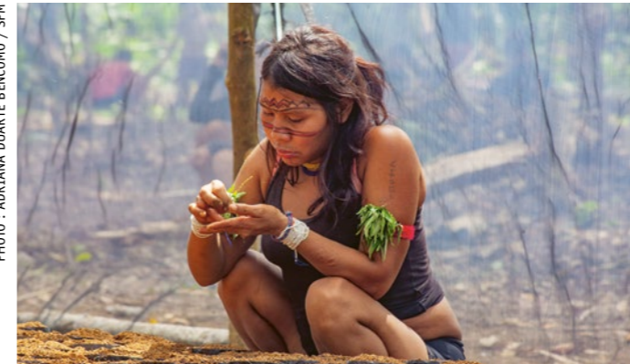
Une femme plante des fèves de cacao dans une serre.

Le développement du projet de culture du cacao était tout sauf évident : les villages yanomami et yek'wana viennent de traverser quatre années particulièrement compliquées. La crise du coronavirus les a lourdement touché·e·s et les orpailleurs n'ont pas manqué de saisir cette occasion. Les communautés sont également fortement impactées par la crise climatique. Outre les inondations et la sécheresse, des incendies incontrôlés dévastent régulièrement leur production : ces communautés qui ont toujours connu la culture sur brûlis ne contrôlent plus cette méthode en raison des nouvelles périodes de sécheresse, et doivent s'adapter à la crise climatique.