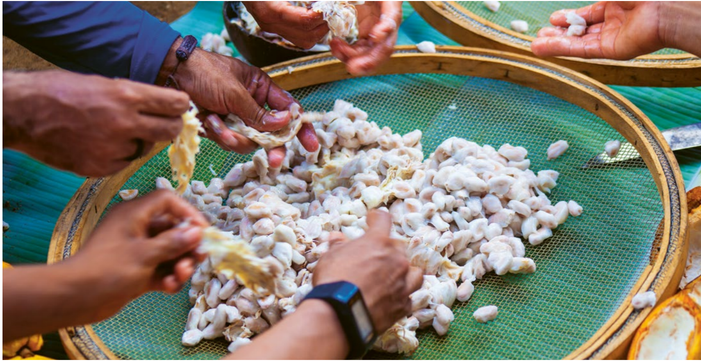
Les fèves sont soigneusement retirées de la coque du fruit du cacaoyer et séparées de la pulpe.