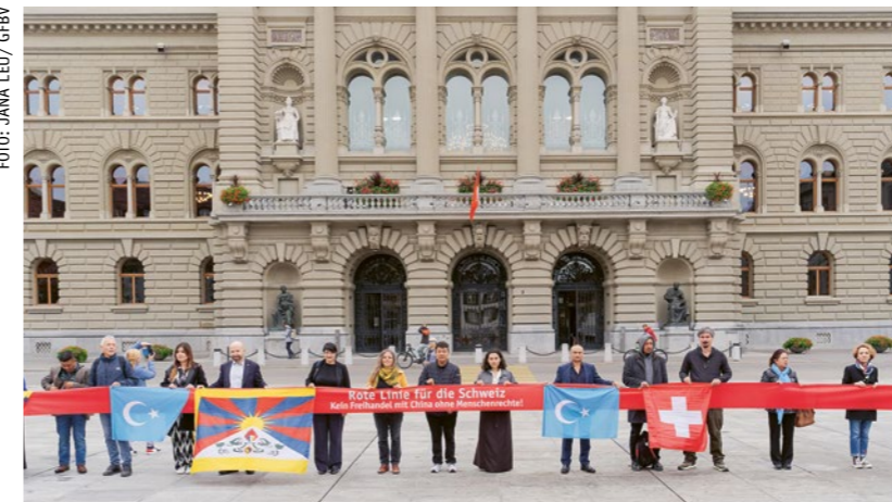
Aktivist:innen und Politiker:innen ziehen bei der Petitionsübergabe am 18. September eine rote Linie auf dem Bundesplatz.

Der Entschluss der Kommission zeigt einmal mehr, dass sich das Verhandlungsmandat in erster Linie an den Wünschen der Schweizer Wirtschaft orientiert und die Verantwortung der Schweiz zur Wahrung der Menschenrechte vernachlässigt. Umso wichtiger ist daher der Widerstand aus der Zivilgesellschaft: Bereits am 18. September reichte die GfbV gemeinsam mit ihren Partnerorganisationen die Petition «Rote Linie für die Schweiz – kein Freihandel mit China ohne Menschenrechte!» mit über 14 000 Unterschriften ein. Sollten die Forderungen nach einem substanziellen Einbezug der Menschenrechte weiterhin ungehört bleiben, wird die GfbV ein Referendum ernsthaft prüfen.