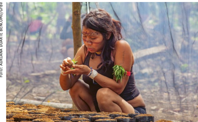
Eine Frau pflanzt Kakao-Bohnen im Gewächshaus.

Dass das Kakao-Projekt wächst, ist nicht selbstverständlich: Die Yanomami- und Yek'wana-Dörfer haben vier ausgesprochen schwierige Jahre hinter sich. Die Corona-Krise traf sie schwer, und die Goldgräber nutzen die Gunst der Stunde. Zudem sind die Gemeinschaften stark von der Klimakrise betroffen. Neben Überschwemmungen und Dürren zerstören immer wieder unkontrollierte Brände ihre Produktion: Sie, die schon immer mit Brandrodung arbeiteten, haben die Methode wegen der neuen Trockenheit nicht mehr unter Kontrolle und müssen sich der Klimakrise anpassen.