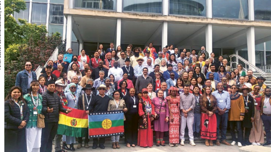
Gemeinsam für eine gerechte Energiewende: Vertreter:innen Indigener Gemeinschaften aus allen Indigenen Weltregionen.

Vom 8. bis 10. Oktober 2024 kamen in Genf über 100 Indigene Delegierte aus der ganzen Welt zusammen: Sie tauschten sich darüber aus, wie eine gerechte Energiewende hin zu einer nachhaltigen Wirtschaft aus Indigener Perspektive aussieht. Gemäss den Delegierten müssen Lösungen für ökologische Krisen Indigenes Wissen miteinbeziehen, statt koloniale Muster der Ausbeutung zu wiederholen.