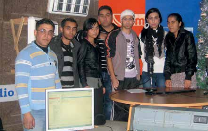
>>> Teilnehmerinnen und Teilnehmer des GfbV-«Capacity Building»-Programms

Die GfbV rief 2011 in Kosovo gemeinsam mit Jugendlichen das Empowerment-Programm «Aktiv für unsere Rechte» ins Leben und unterstützt das Programm seither. Junge Roma-VertreterInnen in fünf Regionen im Kosovo engagieren sich, um die Minderheitenrechte und Mitbestimmung in Gesellschaft und Politik zu verbessern. Ziel ist, die junge Roma-Generation zu befähigen, Strukturen und Netzwerke aufzubauen, um selbstbestimmt ihre Rechte einfordern zu können. Von einem erstarkten aktiven Auftreten der jungen Roma profitiert die gesamte Roma-Gemeinschaft. Dies wirkt sich insbesondere auf die Bekämpfung von Diskriminierung positiv aus.