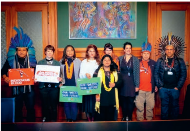
Ein Teil der Delegation mit Parlamentarierinnen im Bundeshaus in Bern.

Von der Schweizer Regierung forderte die Delegation, gegenüber der brasilianischen Regierung klar Stellung zu beziehen für die Rechte der Indigenen und den Schutz der Umwelt. Darum muss das aktuell in der Schweiz diskutierte Freihandelsabkommen zwischen den Mercosur- und EFTA-Staaten griffige Klauseln zu diesen beiden Themen enthalten. Anders ist zu befürchten, dass die erleichterten Handelsbeziehungen die Umweltzerstörung und die Verletzung der Rechte der Indigenen vorantreiben werden.