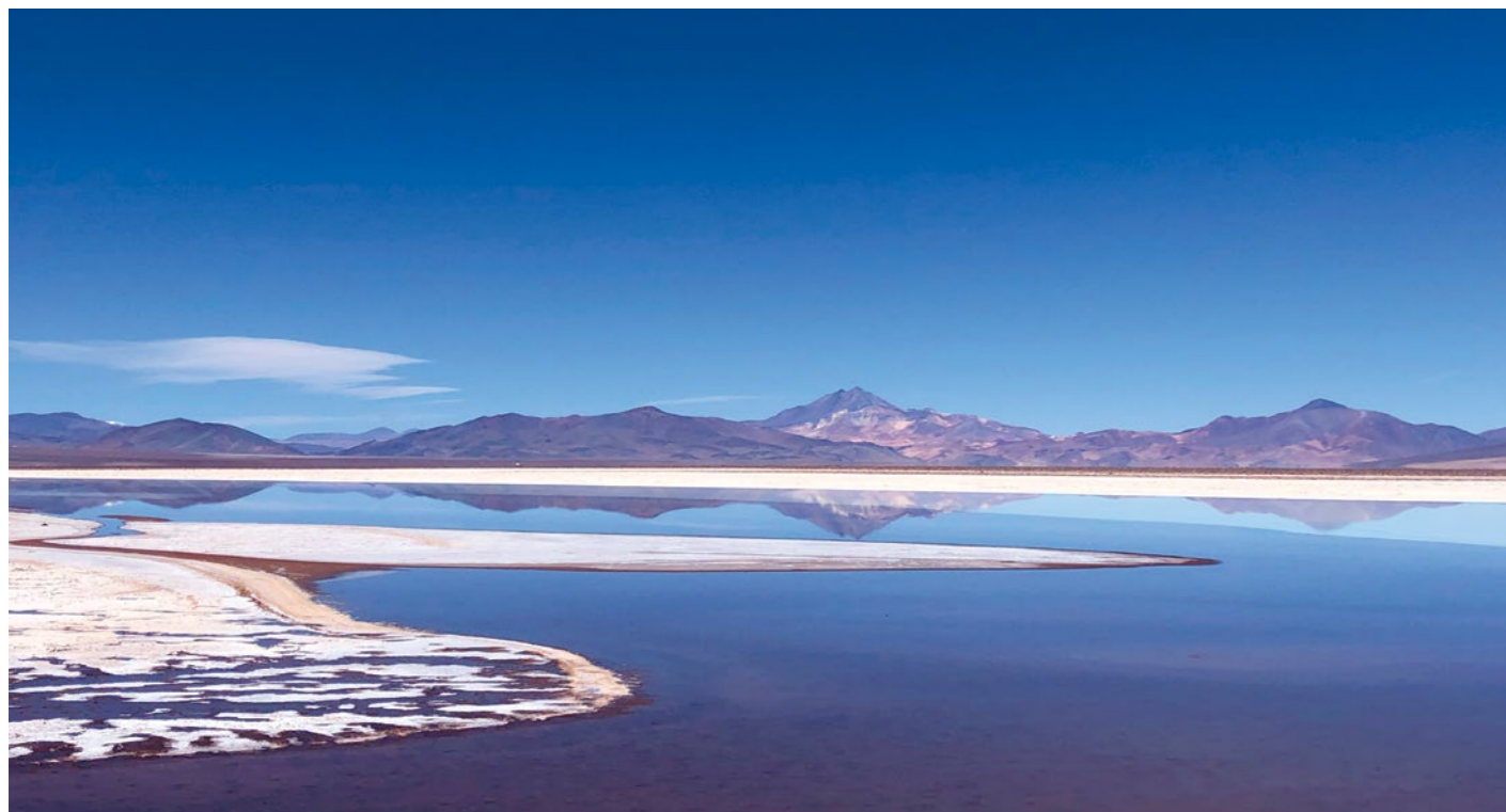
Grâce à la nappe phréatique des lacs salés, le désert d'Atacama abrite des communautés autochtones.

chilien, il s'agit là d'une manne financière considérable. Mais la découverte de gigantesques gisements de lithium en dormance dans les lacs de sel isolés entre Copiapó et la frontière argentine ne fait pas le bonheur de tout le monde.