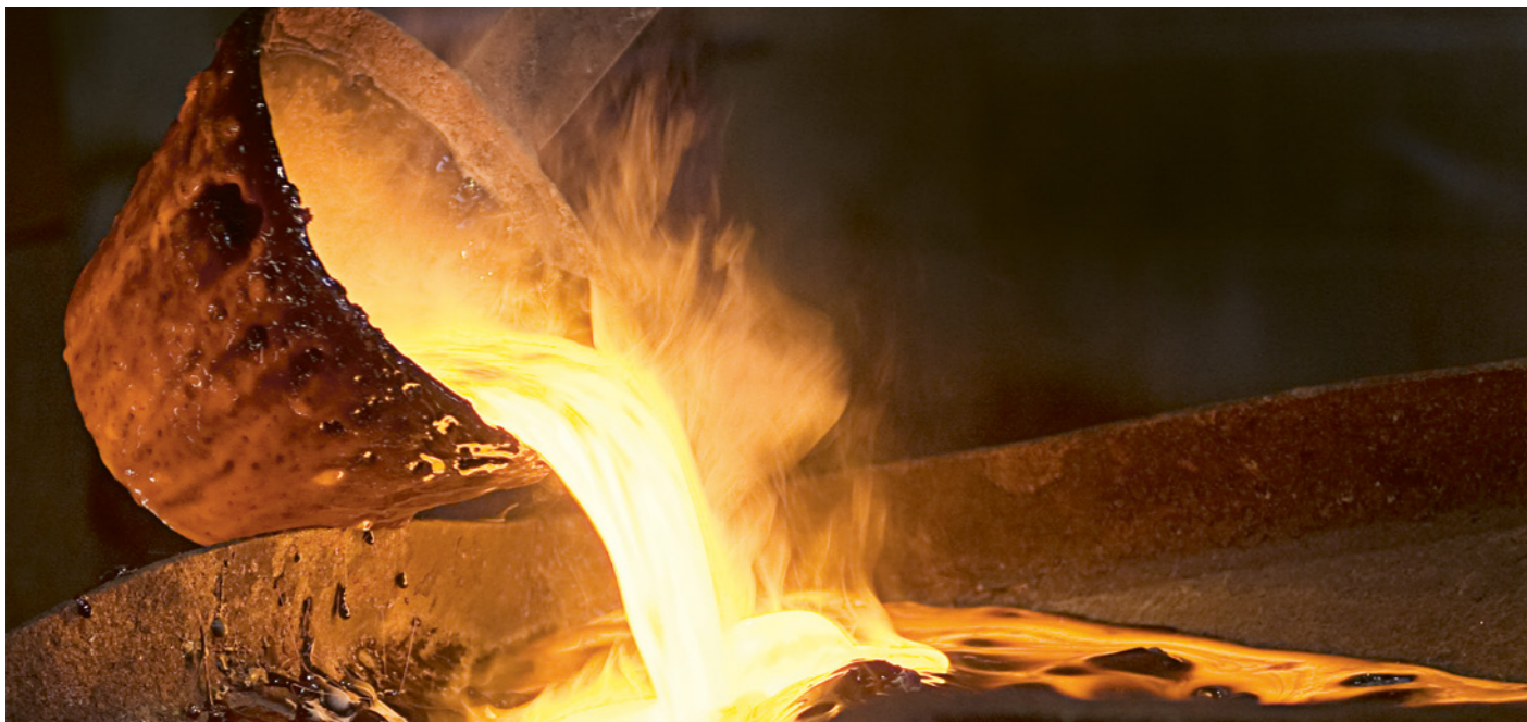
Une fois fondu, il est pratiquement impossible de déterminer l'origine de l'or. Cela est également dû à l'absence de cadre légal.

Depuis la chute d'Omar el-Béchir, les paramilitaires ont renforcé encore davantage leur contrôle sur le commerce aurifère, en étendant notamment leur influence sur la sphère politique et sur des mines situées hors de leur contrôle militaire. Un mois après le début de la guerre, la raffinerie d'or du pays et les avoirs en or de la Banque centrale soudanaise tombaient aux mains des Forces de soutien rapide. Négocier de l'or avec le Soudan signifie très probablement traiter avec les paramilitaires.