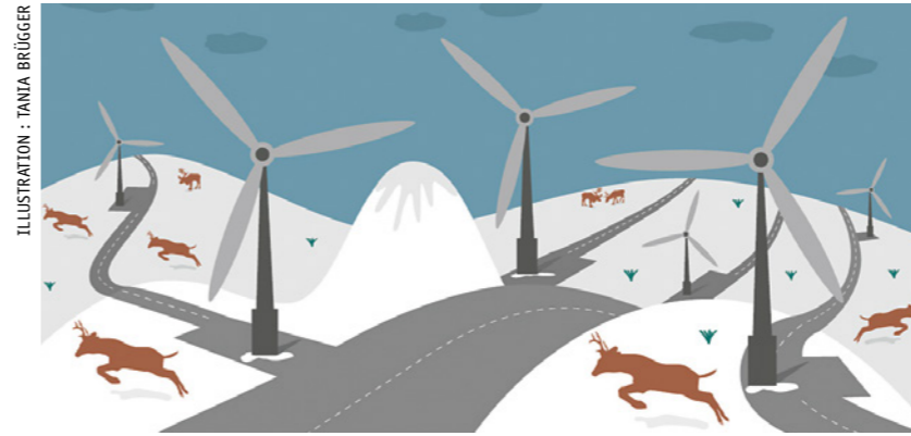
Les rennes évitent les turbines et ne traversent pas les innombrables routes d'accès qui découpent la région depuis la construction de ce projet d'énergie dite verte.

Au travers d'une pétition, la SPM soutient les communautés des Saami·e·s du Sud de la péninsule de Fosen en Norvège et demande que les deux entreprises suisses EIP et BKW s'engagent enfin pour le démantèlement du parc éolien dans la région et pour la renaturation des sites. Il y a plus de deux ans, la Cour suprême de Norvège avait rendu un arrêt dans lequel elle estimait que les parcs éoliens implantés dans les régions de Storheia et Roan sur Fosen constituaient une violation des droits humains des Saami·e·s du Sud. Mais le parc est toujours en activité et génère des bénéfices.