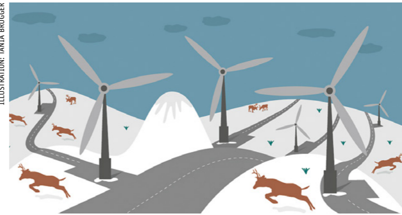
Die Rentiere meiden die Turbinen und überqueren die unzähligen Zufahrtsstrassen nicht, die seit dem Bau des sogenannten grünen Energieprojekts das Gebiet zerschneiden.

Genau zwei Jahre nach dem Gerichtsurteil riefen Anfang Oktober in Norwegen Saami-Organisationen und Umweltverbände zu Protesten auf. Hunderte Saami- und Umweltaktivist:innen besetzten mit saamischen Zelten eine Hauptstrasse in Oslo und forderten, dass dem Urteil endlich Taten folgen. Denn die illegalen Windturbinen stehen mitten auf den letzten verbliebenen Winterweiden und bedrohen die Rentierzucht – und damit das wirtschaftliche und kulturelle Leben der Indigenen Rentierzucht-Gemeinschaft Fovsen Njaarke.