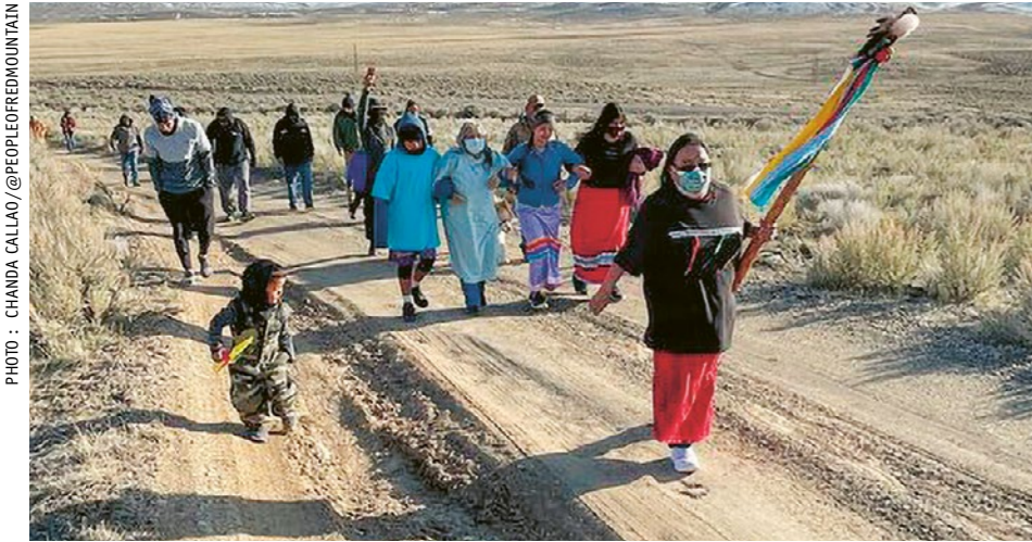
Les communautés autochtones sensibilisent aux conséquences du projet de mine de lithium à Peehee Mu'huh.

Aux Etats-Unis, un gisement de lithium est exploité sans l'accord des Païutes et des Shoshones, notamment pour des véhicules électriques. Les communautés autochtones s'y opposent, car la mine saccage non seulement leurs terres mais aussi leur histoire. Des problèmes anciens se perpétuent ainsi – cette fois-ci au nom de la transition énergétique. Et ce gisement sur les terres païutes et shoshones est loin de faire exception.