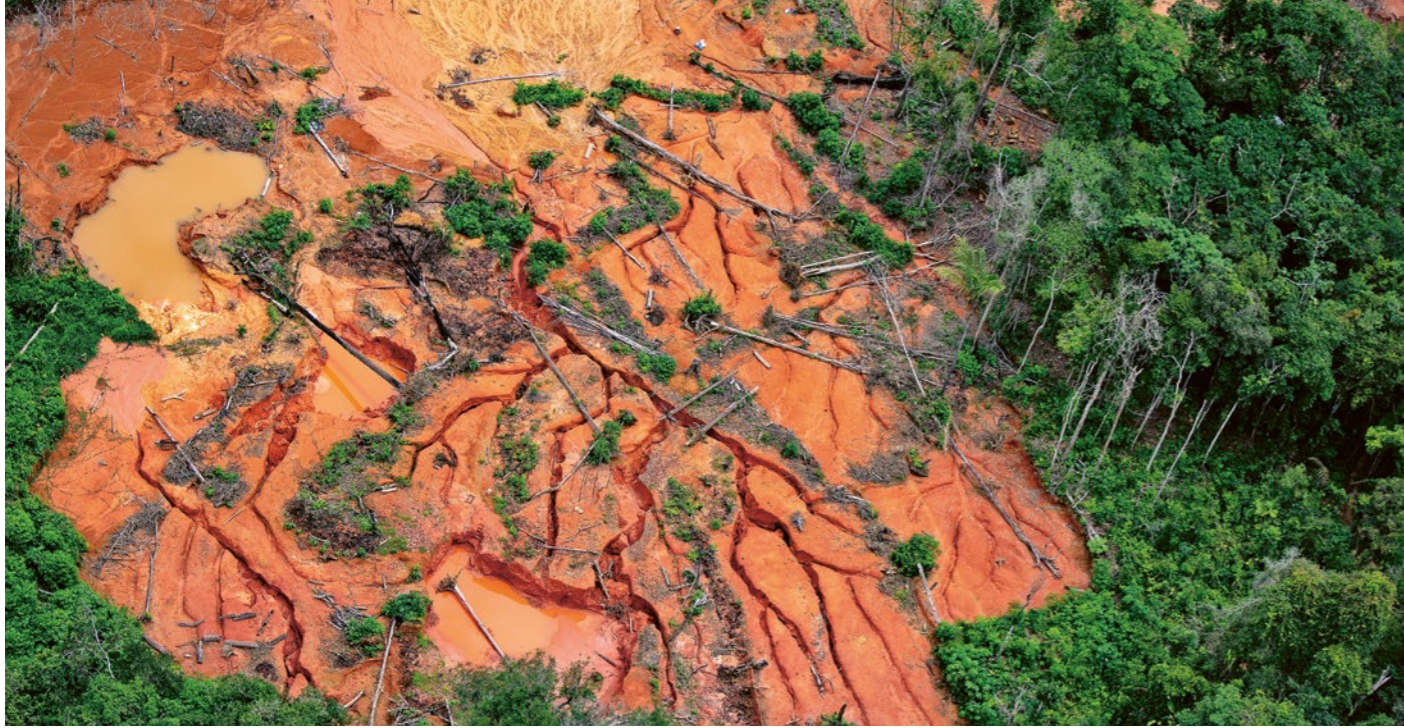
L'exploitation illégale de l'or et les destructions qui en découlent sur le territoire des Yanomami doivent cesser sous Lula.

Constitution du pays ainsi que la Convention de l'OIT 169 relative aux peuples indigènes et tribaux, entrée en vigueur en 2002 au Brésil, stipule clairement que l'Etat se doit d'identifier, reconnaître et protéger les territoires autochtones.