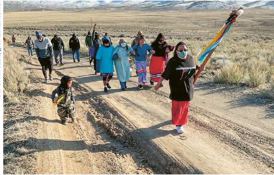
Indigene Gemeinschaften sensibilisieren für die Folgen der geplanten Lithiummine in Peehee Mu'huh.

In den USA wird ohne das Einverständnis der Paiute und Shoshone eine Lithiummine auf ihrem Gebiet gebaut, unter anderem für Elektromobile. Doch die indigenen Gemeinschaften leisten Widerstand: Die Mine zerstört nicht nur ihr Land, sondern löscht auch ihre Geschichte aus. Damit werden jahrhundertalte Probleme fortgeführt - diesmal im Namen der grünen Wende. Und die Mine auf dem Gebiet der Paiute und Shoshone ist kein Einzelfall.