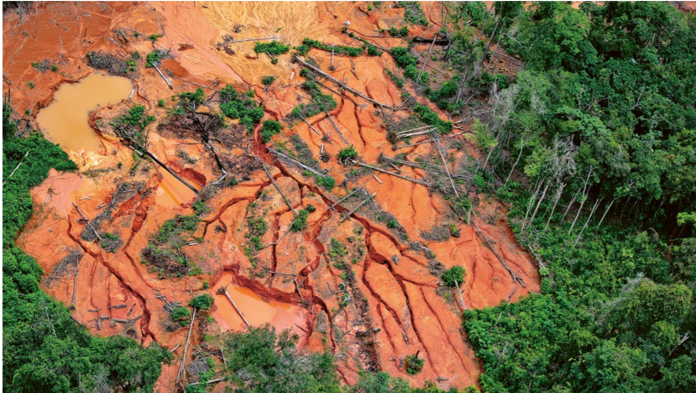
Der illegale Goldabbau und die damit einhergehende Zerstörung im Gebiet der Yanomami soll unter Lula beendet werden.

in Brasilien seit 2002 in Kraft, halten unmissverständlich fest: Indigene Gebiete müssen abgegrenzt, den Gemeinschaften zugesprochen und staatlich geschützt werden.