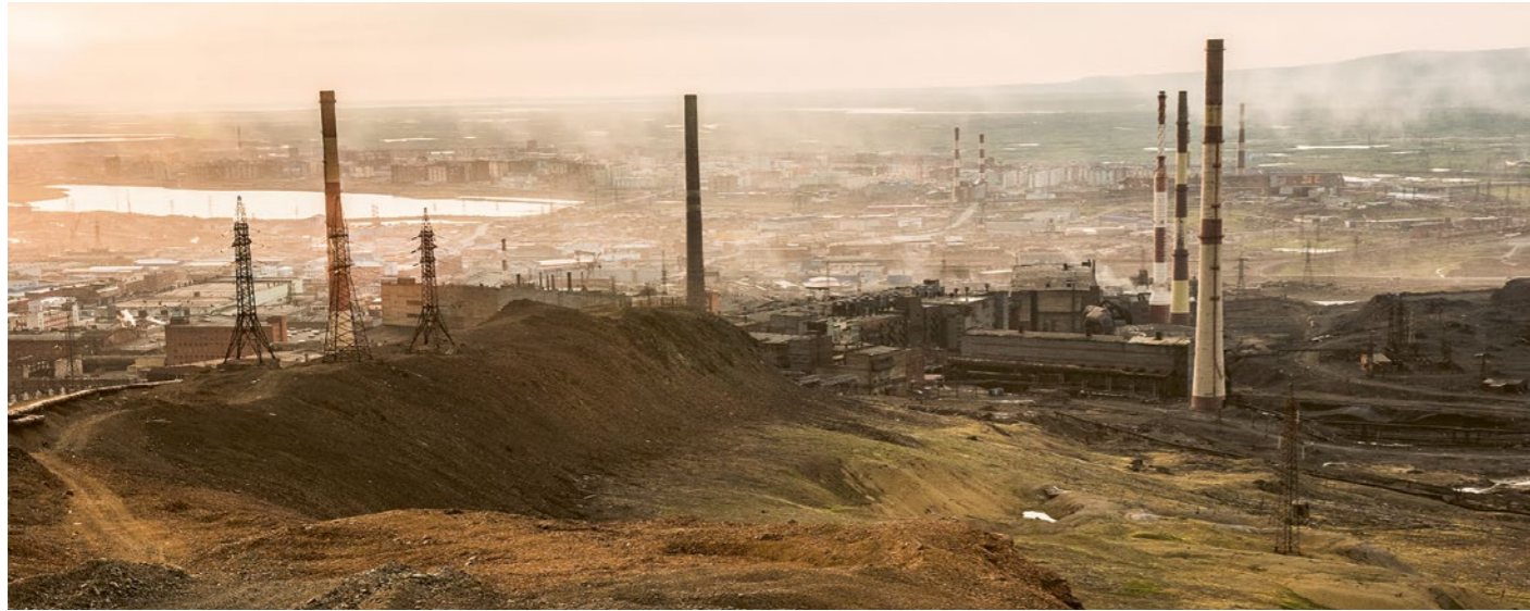
Industrieanlage von Norilsk Nickel nahe der stark verschmutzten arktischen Stadt Norilsk. Viele indigene Territorien in Russland sind durch staatsnahe Rohstoff- und Schwerindustrie-Konzerne arg verwüstet. Solche Zerstörung geschieht angesichts der aktuellen Repression noch mehr abseits der Öffentlichkeit.

wie Francisco Calí Tzay, UN-Sonderberichterstatter für die Rechte indigener Völker und seine renommierte Vorgängerin Victoria Tauli-Corpuz.