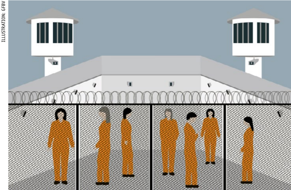
Die sogenannten „Xinjiang Police Files“, im Mai geleakte Fotos und Dokumente der chinesischen Behörden, offenbarten die brutale Unterdrückung in den Zwangslagern.

Jüngste Enthüllungen zu Ostturkestan (chinesisch: Xinjiang) schockieren und beweisen abermals, wie grausam Peking uigurische und weitere Bevölkerungsgruppen unterdrückt. Das bewegt auch die Schweiz: Immer mehr Stimmen fordern politischen Druck statt die eigennützige Verfolgung von Wirtschaftsinteressen. Dass sich die hiesige Politik bewegt, ist zu begrüßen. Doch verglichen mit den Massnahmen der USA und der EU, bleibt die Schweiz bisher untätig. Die GfbV will das politische Momentum nutzen und plant diesen Herbst gemeinsame Aktionen mit der uigurischen Bewegung.