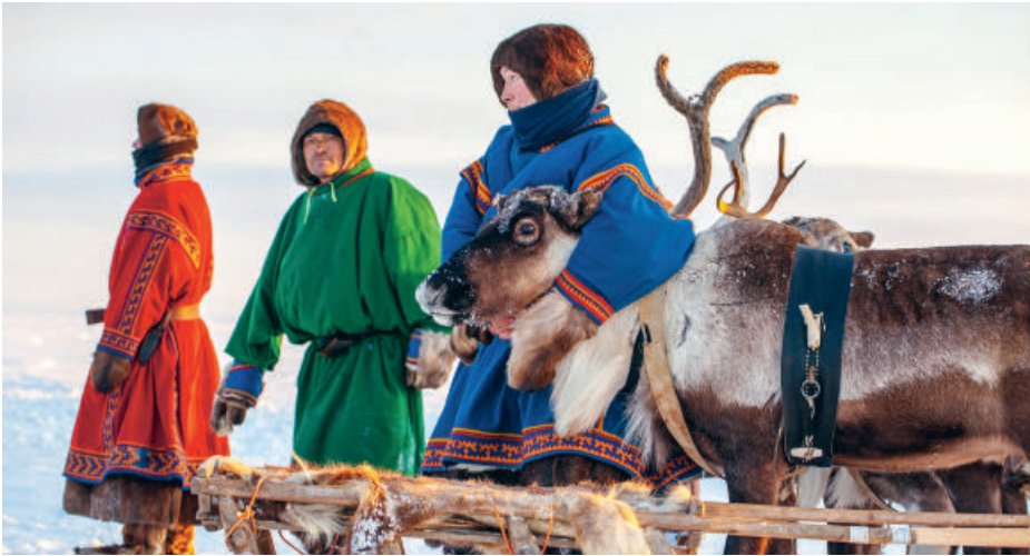
Les éleveurs de rennes autochtones résistent aux projets d'extraction de ressources qui détruiraient leur tradition et leur mode de vie.

L'Arctique abrite de nombreuses communautés autochtones mais leur mode de vie traditionnel est de plus en plus menacé par des projets économiques, l'extraction des matières premières et les conséquences du changement climatique.