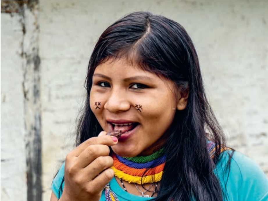
Ein Mädchen probiert die Schokolade, die mit Kakao aus dem Projekt hergestellt wurde.

Der Abbau von Gold im brasilianischen Amazonasgebiet hat schwerwiegende Folgen für Mensch und Umwelt. Trotzdem ist er für viele junge Indigene die einzige Möglichkeit für einen Verdienst. Indigene Leaderinnen und Leader haben dieses Problem erkannt und ein nachhaltiges Kakaoprojekt ins Leben gerufen, welches auch von der GfbV unterstützt wird.