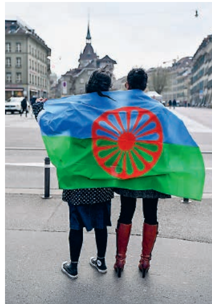
Aus Angst vor Diskriminierung verzichteten viele Roma auch heute noch darauf, öffentlich als Roma aufzutreten.

In der Schweiz gibt es zu wenig Halteplätze für Jenische, Sinti und Roma. Gemäss der Stiftung «Zukunft für Schweizer Fahrende» gibt es gegenwärtig nur 15 Standplätze und rund 40 Durchgangsplätze. Diese sind vor allem Schweizer Jenischen und Sinti vorbehalten. Jenische, Sinti und Roma aus dem Ausland sind aktuell auf 9 Plätzen zugelassen, wobei nur zwei raumplanerisch gesichert sind. Der Platzmangel ist nach wie vor akut.